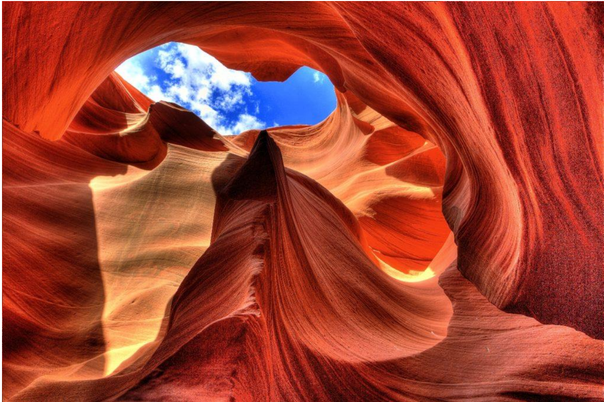
Antelope Canyon 1