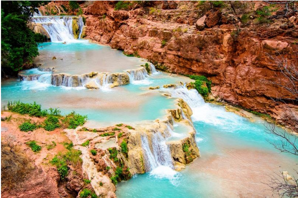
Havasus Falls