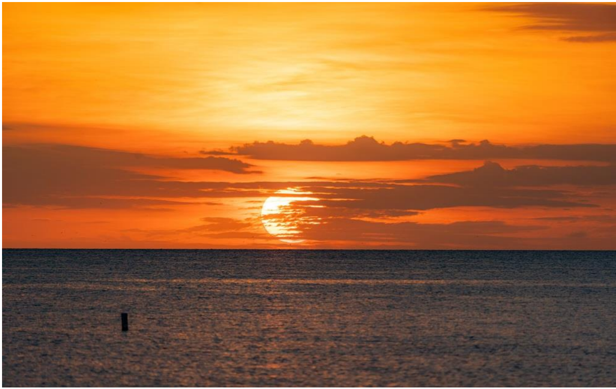
Sonnenuntergang St. Pete

Sonnenuntergang zu einem Event mit Musikeinlagen und Auftritten von Künstlern und Akrobaten wird.