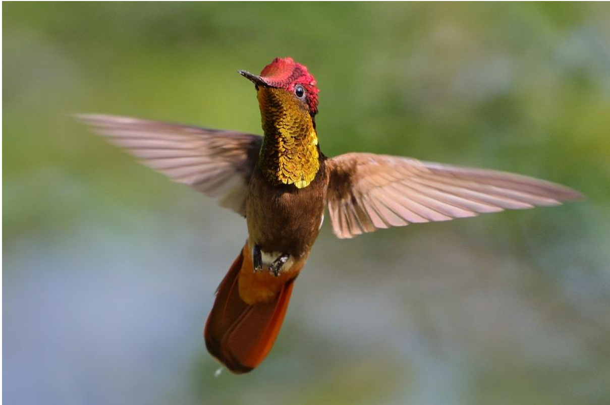
Vogelsafari 2