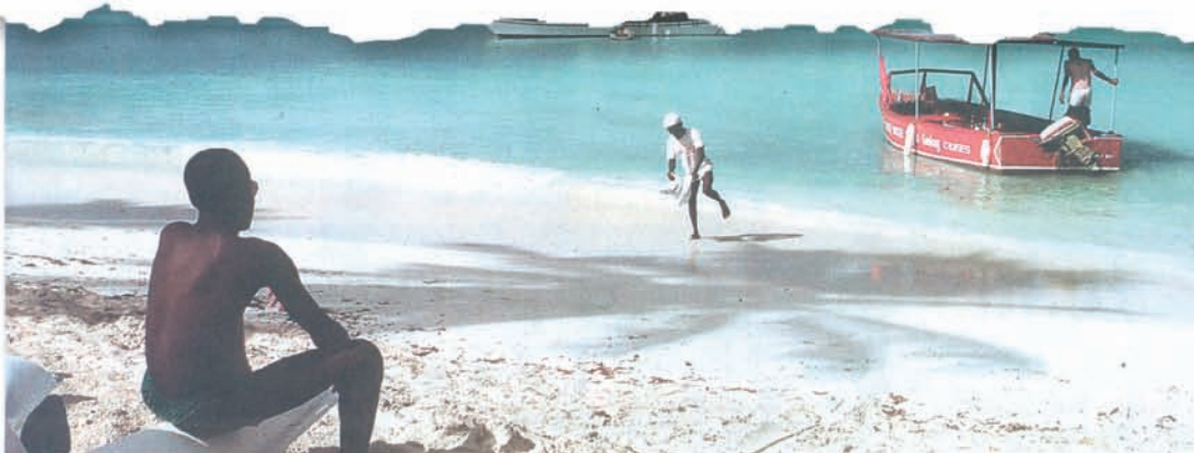
Endlose weiße Strände und blaues Meer sind neben der Aloe Vera auch noch sehr gute Gründe für einen Trip in die Karibik.